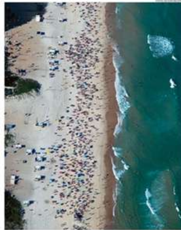
Vista assim de alto. A beira do Posto 6, que é sagrada por dove em uma das imagens exclusivas do livro "A orla do Rio"

cidade não tardou a entender-se pela várzea em torno, mesmo pontar, destinada a ser marítima por excelência, não podiam as praias deixar de atrair Li", escreveu Brasil Gerson no clássico "História das ruas do Rio". Outro livro, "A orla do Rio", recém-lançado pela editora ID Cultural, mostra como, através dos séculos, os caminhos da cidade e de seus moradores continuaram entrelaçados aos de seu litoral.